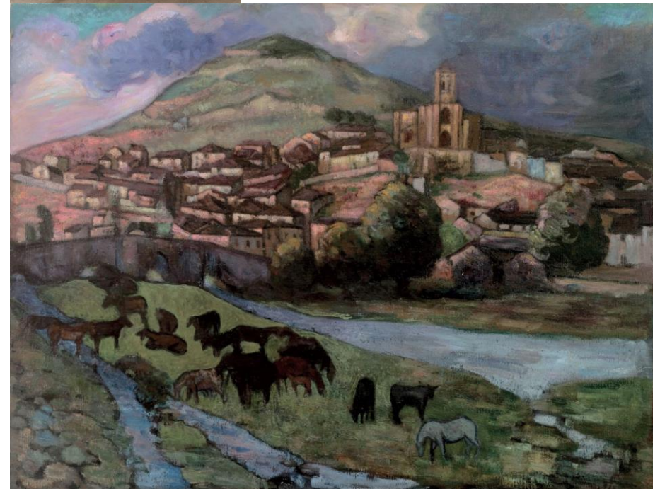
Paisaje de Pampliega (anochecer)

"Es el anochecer, un pueblo en anfiteatro de casas viejas. Arriba se destaca sobre la gradería que forman aquellas, la torre cuadrada y maciza de la iglesia con aire de fortaleza, y detrás el monte de un verde parduzco, al que el pueblo, como temiendo dejarse sorprender, está adosado. Allí abajo, en primer término, un puente y un riachuelo, en el que beben unas caballerizas más o menos apocalípticas." (Carta de Juan de Echevarría al crítico de arte Juan de la Encina, s/f.)